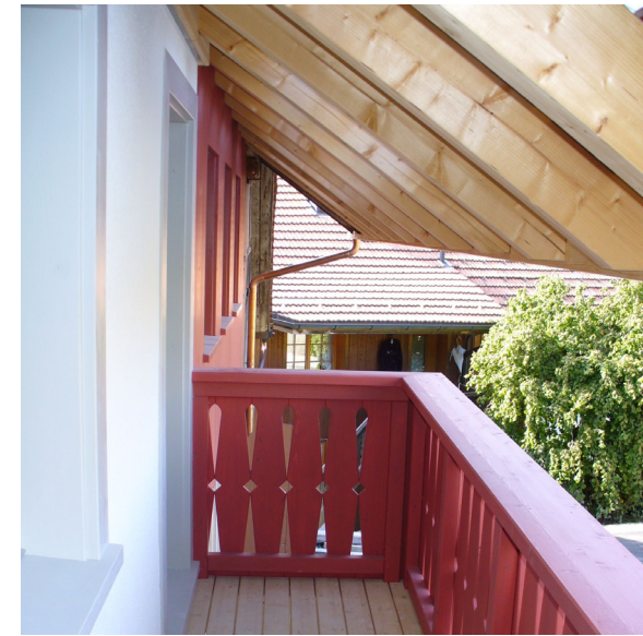
Umbau/Teilneubau Bauernhaus im Dorfkern Oberschlatt

Die Bauherrschaft hat das bis anhin bestehende Bauernhaus 2006 in der Absicht gekauft, es zu erhalten und zu erneuern. Der ganze Flarz ist beziehungsweise war baulich in einem schlechten Zustand, weshalb das Wohnhaus bis auf das Untergeschoss, einige Fassadenteile im Erdgeschoss und den Kachelofen abgebrochen und neu erstellt wurde. Entstanden ist nicht ein anonymer Neubau; das Gebäude behält den Charakter des Altbaus, wurde aber konstruktiv neu interpretiert innerhalb des bestehenden Volumens. Eine Besonderheit sind die sehr gedrungeneren Geschosshöhen (EG 2,15, OG 1,95 m lichte Höhe). Dank minimierter Deckenquerschnitte und der sichtbaren Deckenkonstruktion mit Holzbalken erscheint der Raum freundlich und grosszügig.